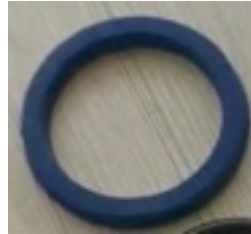
D Seal: 28*36*6