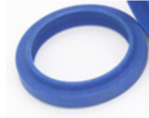
Dust Ring: d28