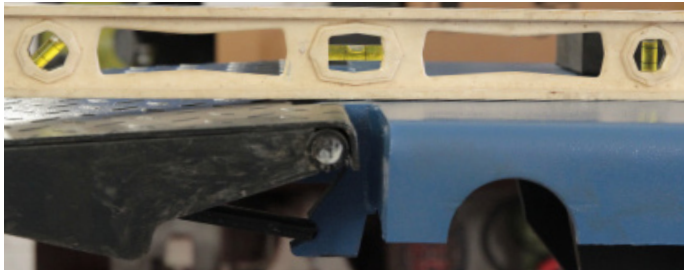
Ausrichtung der Auffahrampen X10, X30

Montage der Auffahrampen: Sprühen Sie die Führungsösen und die Sicherungsstange der Auffahrampen mit Montagespray ein. Platzieren Sie die Rampen so an der Bühne, dass die Handgriffe nach außen zeigen. Schieben Sie hieran die Sicherungsstange durch die Führungsösen und arretieren Sie diese. Achten Sie auf einen ebenen Stand der Auffahrampen. Wiederholen Sie den Vorgang für die andere Rampe.