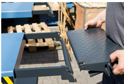
Ausrichtung der Auffahrampen X40