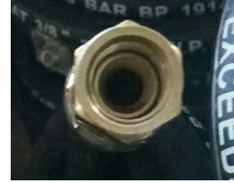
NPT3/8, NPT1/4 C Typ Anschluss