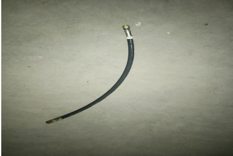
Hydraulikschlauch große Schere